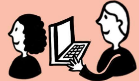
ПОЛЬЗОВАТЕЛИ И ЗАИНТЕРЕСОВАННЫЕ ЛИЦА