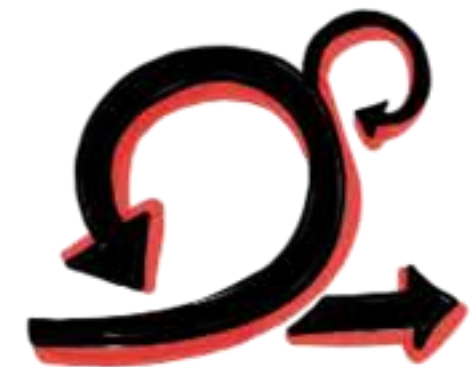
Large-Scale Scrum to Scrum