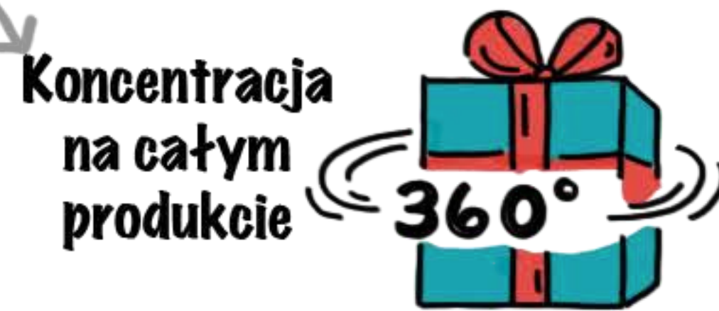
Koncentracja na całym produkcie