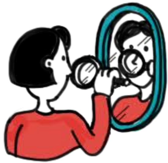
Empiryczna kontrola procesu