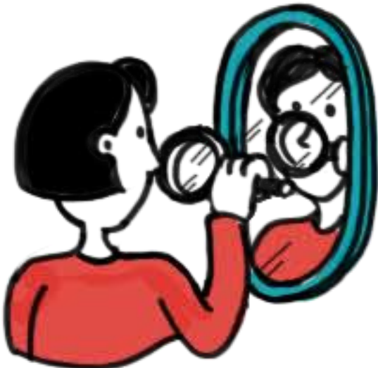
Empiryczna kontrola procesu