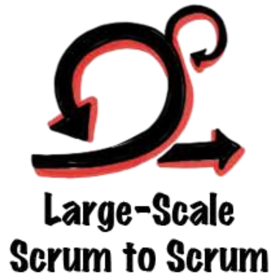
Large-Scale Scrum to Scrum